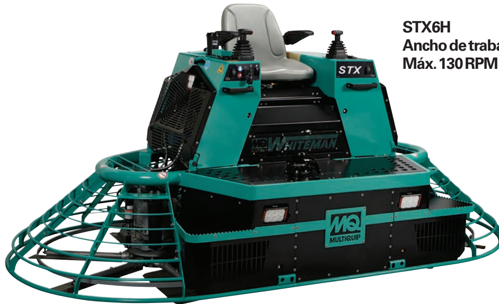
STX6H Ancho de trabajo de 297 cm Máx. 130 RPM

La allanadora de operador a bordo serie STX es líder en la industria cuando se trata de producir la máxima planeidad del suelo. Beneficios esperados por los contratistas y entregados por el líder en la industria