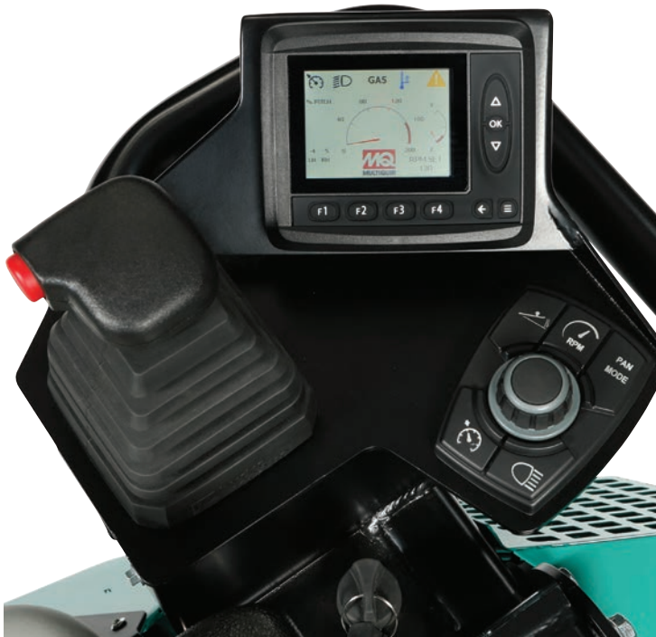
Panel de control de la STXDF